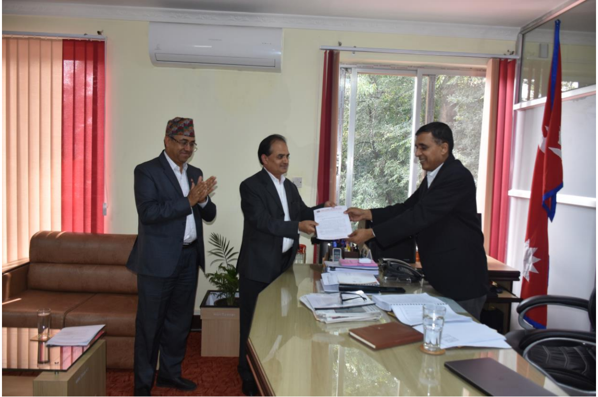
आयोगका सचिवबाट माननीय अध्यक्षज्यू समक्ष आयोगको नियमावली पेश गर्दै