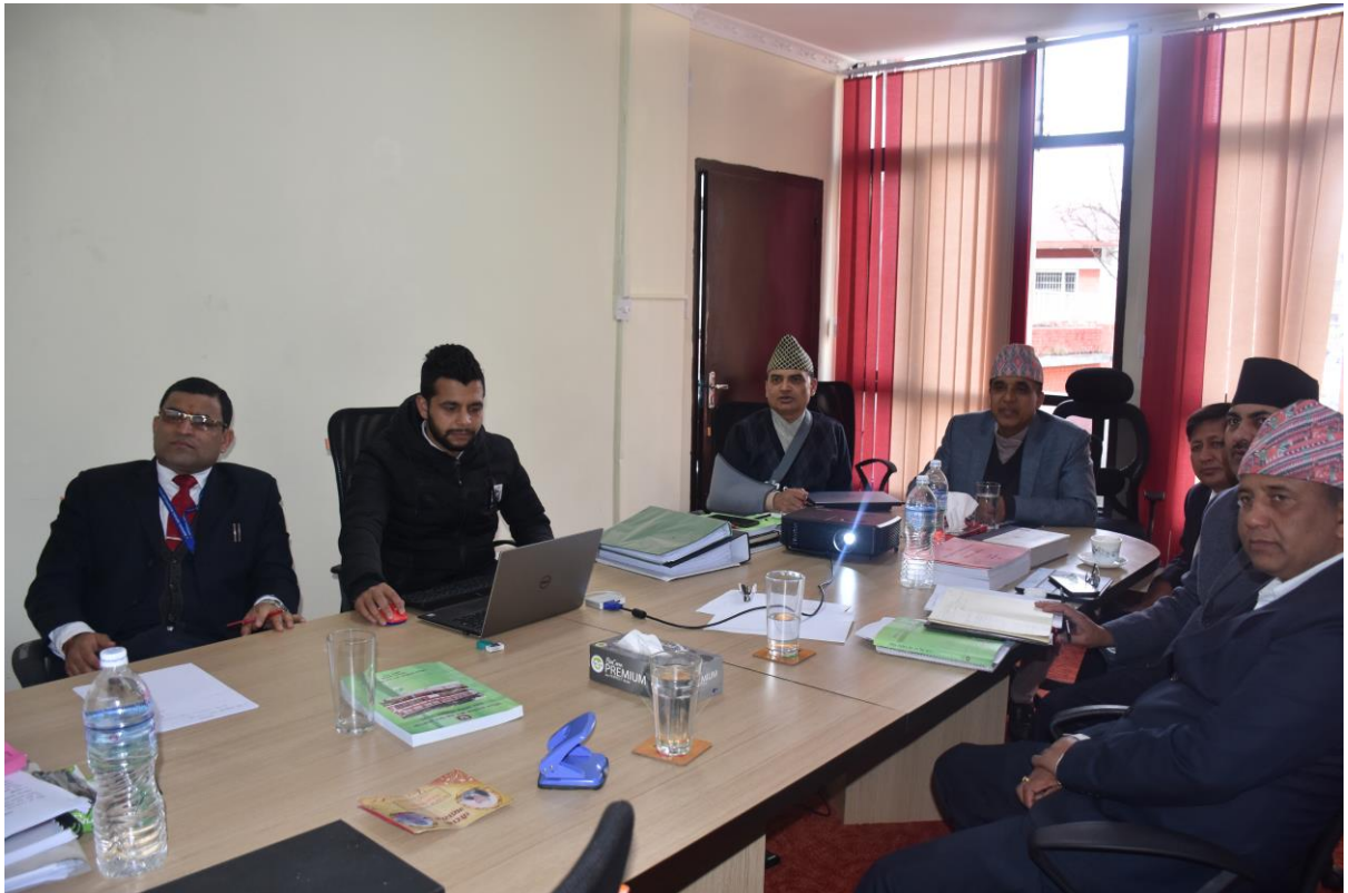
आर्थिक वर्ष २०७७/०७८ का लागि सिफारिसको पूर्व तयारी अवस्था