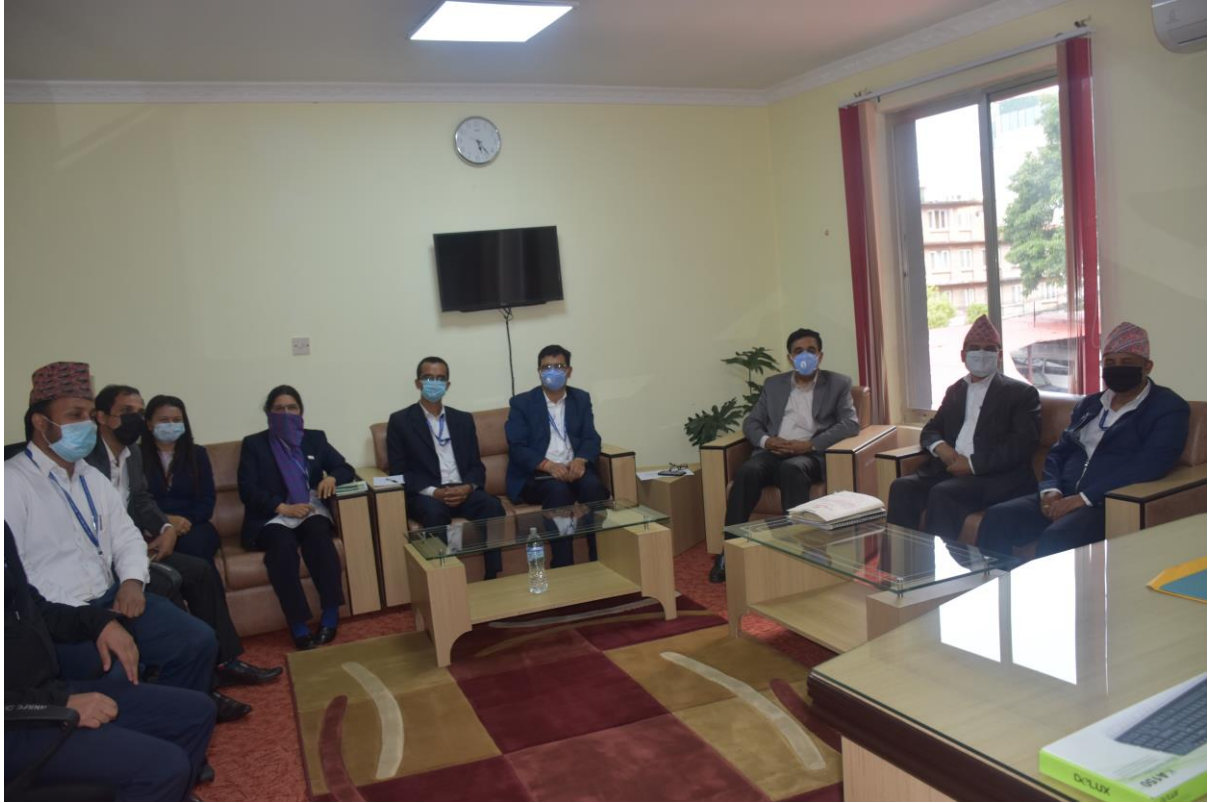
आयोगका माननीय अध्यक्षज्यू समक्ष प्राकृतिक स्रोतसम्बन्धी विषयका सम्बन्धमा आयोगमा छलफल हुँदै