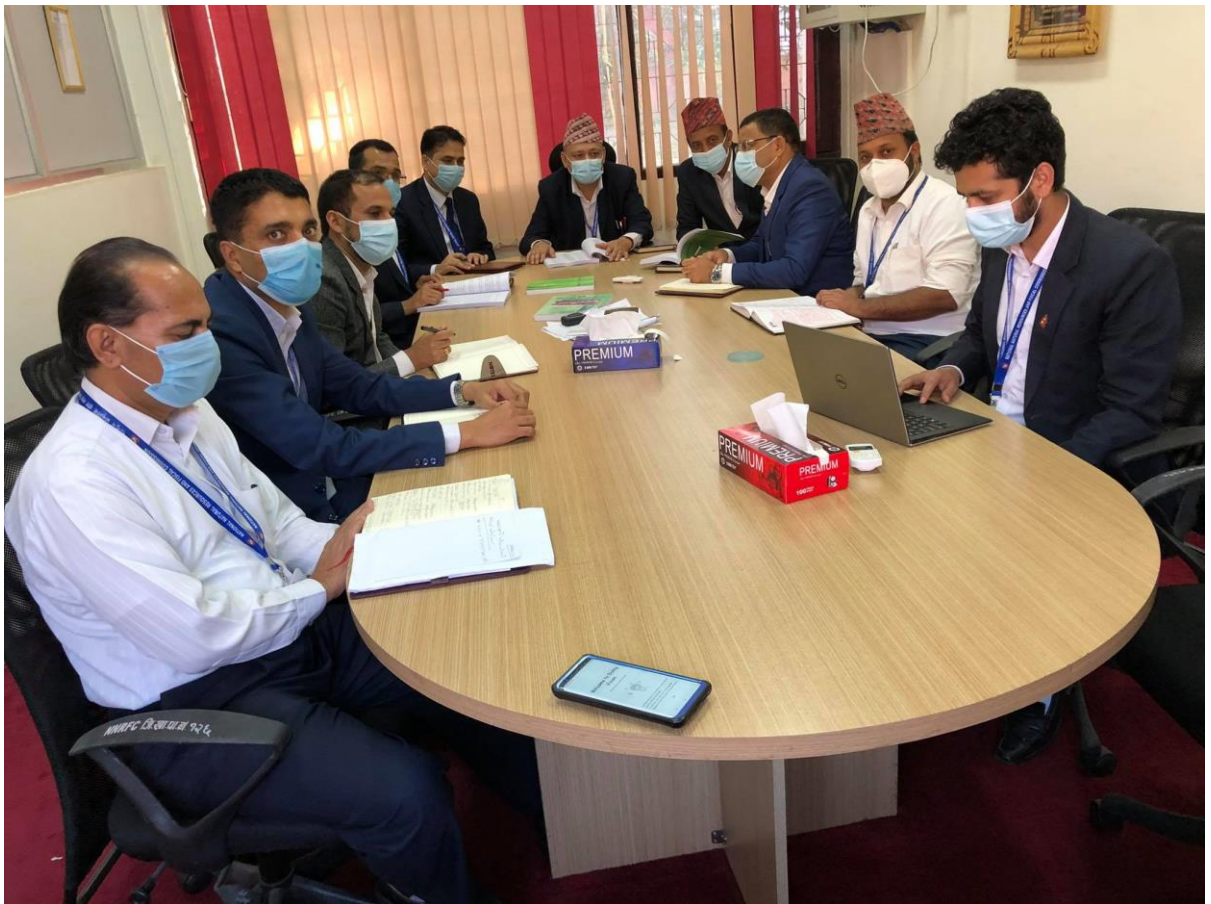
आयोगको दोस्रो वार्षिक प्रतिवेदन तयारीमा जुट्दै, आयोगका कर्मचारीहरू