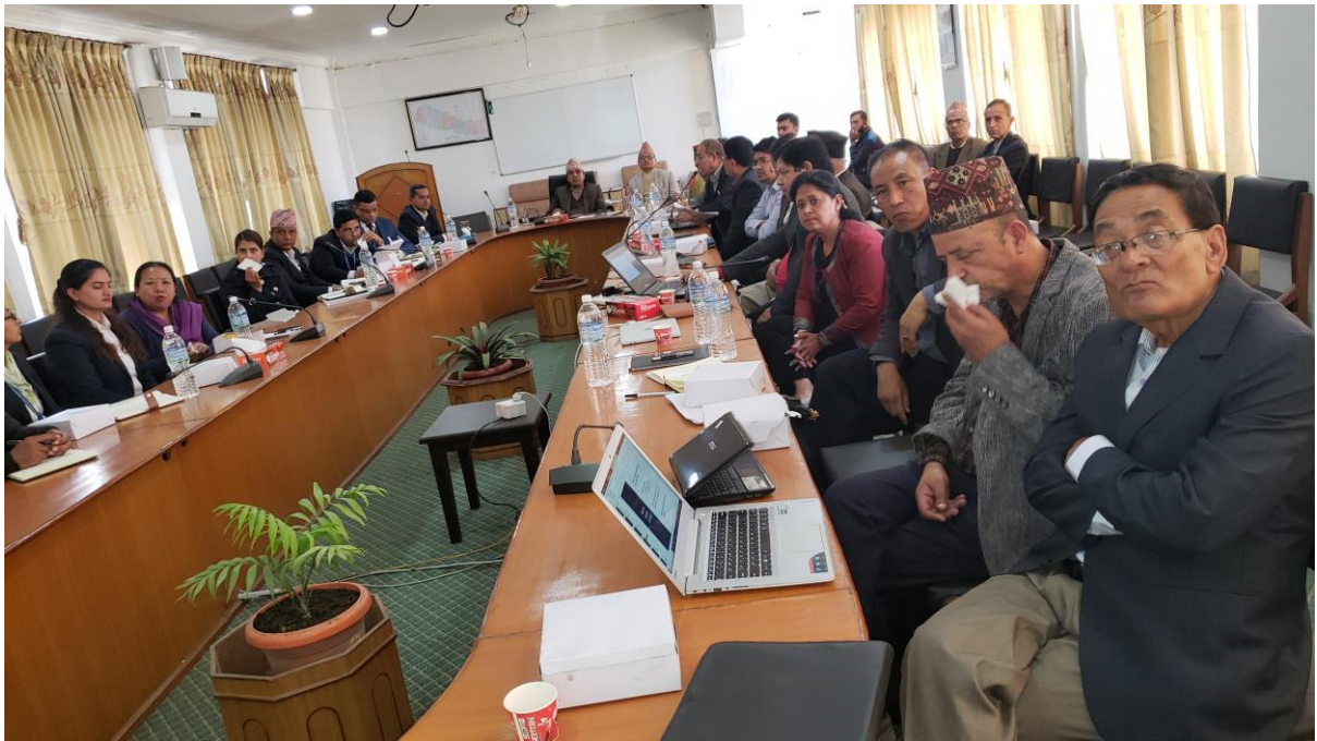
प्रदेश र स्थानीय तहको खर्चको आवश्यकता र राजस्वको क्षमता बीचको अन्तर निर्धारणसम्बन्धी छलफल