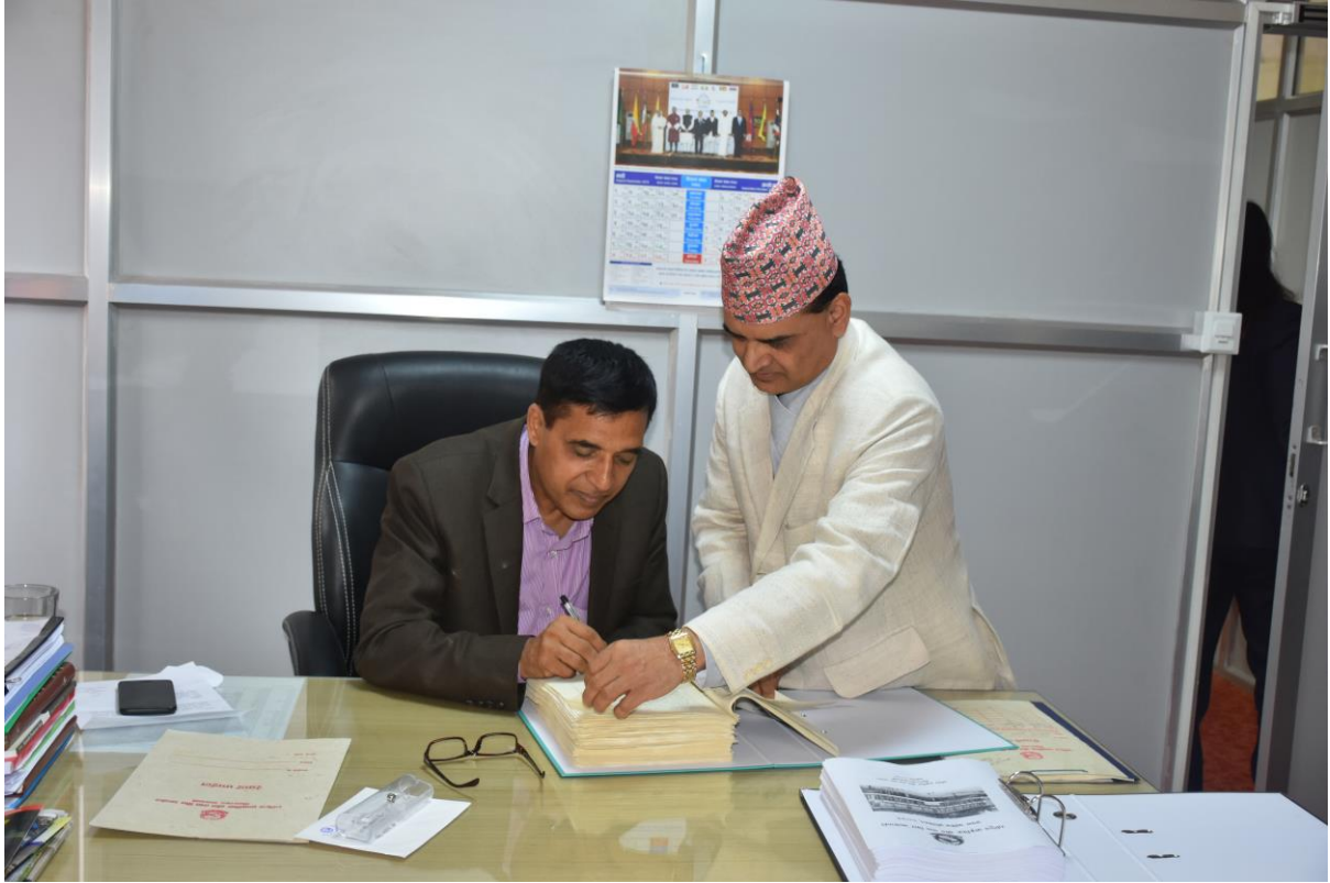
आयोगका माननीय अध्यक्षज्यूबाट आयोगको निर्णयमा हस्ताक्षर हुँदै